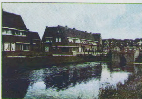
De brug rond 1930.

Van de Warnersbrug zijn helaas uitsluitend zwart-wit beelden beschikbaar, maar in 2021 hebben we d.m.v. een computerprogramma kleur in de beschikbare beelden kunnen brengen. Op de voorzijde van dit jaarverslag en hieronder ziet u hoe de brug meer kleur kreeg.