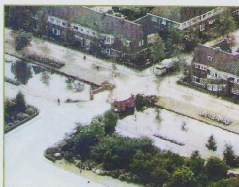
Een luchtfoto van kort voor 1960.