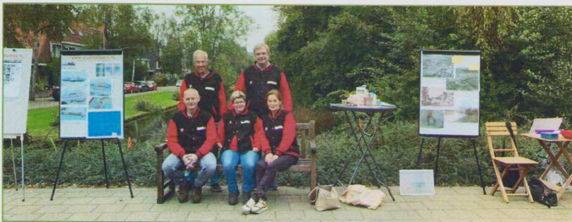
Het team van de Stichting Warnersbrug op de brug op 25 september 2021.

Kort voor deze presentatie gaf het team van de Stichting Warnersbrug op 25 september 2021 acte de presence tijdens de landelijke burendag. Op de Warnersbrug werd een bank neergezet en er werden gesprekken gevoerd met de passanten.