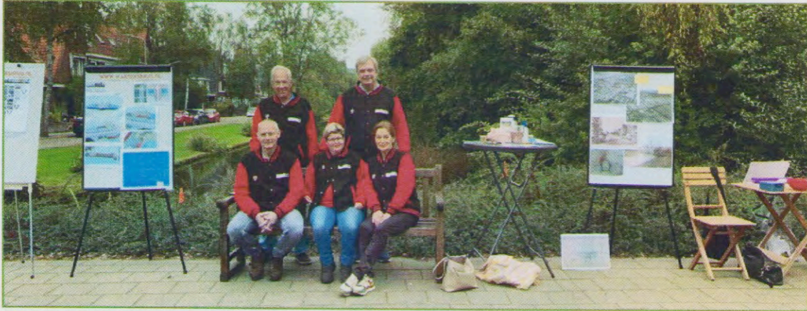
Het team van de Stichting Warnersbrug op de brug op 25 september 2021.

Kort voor deze presentatie gaf het team van de Stichting Warnersbrug op 25 september 2021 acte de presence tijdens de landelijke burendag. Op de Warnersbrug werd een bank neergezet en er werden gesprekken gevoerd met de passanten.