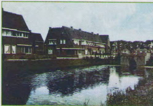
De brug rond 1930.

Van de Warnersbrug zijn helaas uitsluitend zwart-wit beelden beschikbaar, maar in 2021 hebben we d.m.v. een computerprogramma kleur in de beschikbare beelden kunnen brengen. Op de voorzijde van dit jaarverslag en hieronder ziet u hoe de brug meer kleur kreeg.