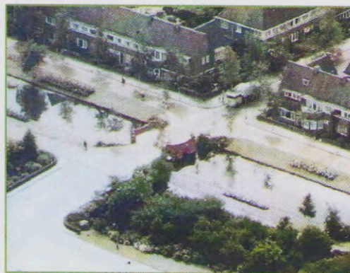
Een luchtfoto van kort voor 1960.